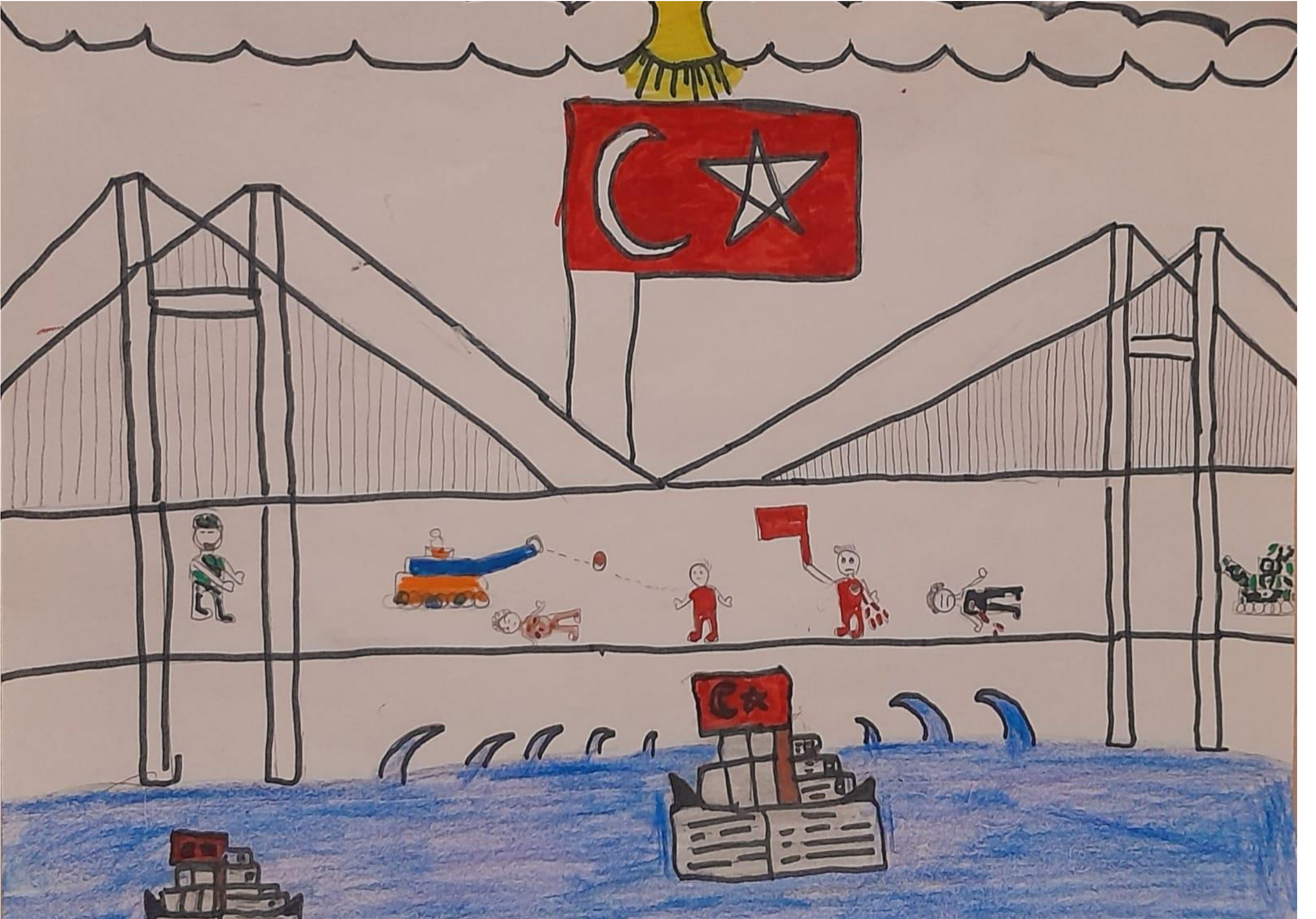
KÜBRA YILMAZ 8/B