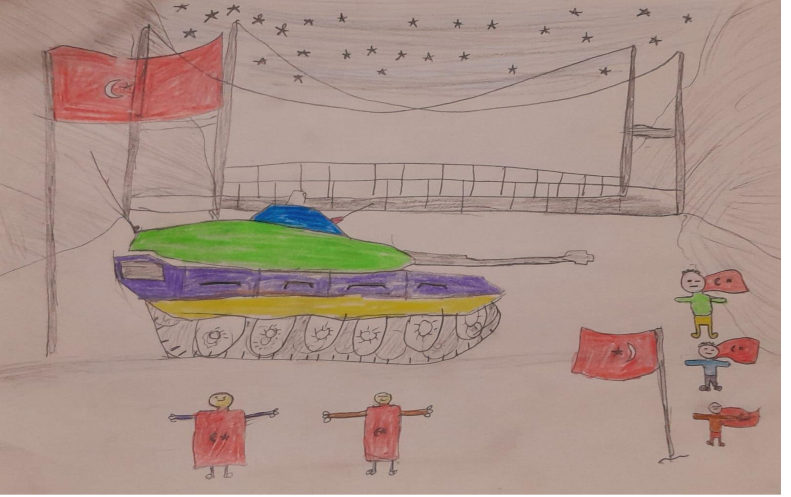
YUNUS EMRE ALAGÖZ 7/C